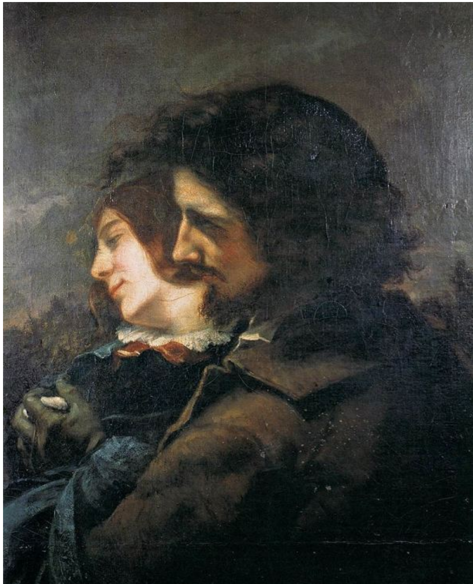
Jean Désiré Gustave Courbet (1819-1877), Les

Prime pubblicazioni: Corriere della Sera , 30 novembre 1913, poi in Un cavallo nella luna , Treves Milano 1918.