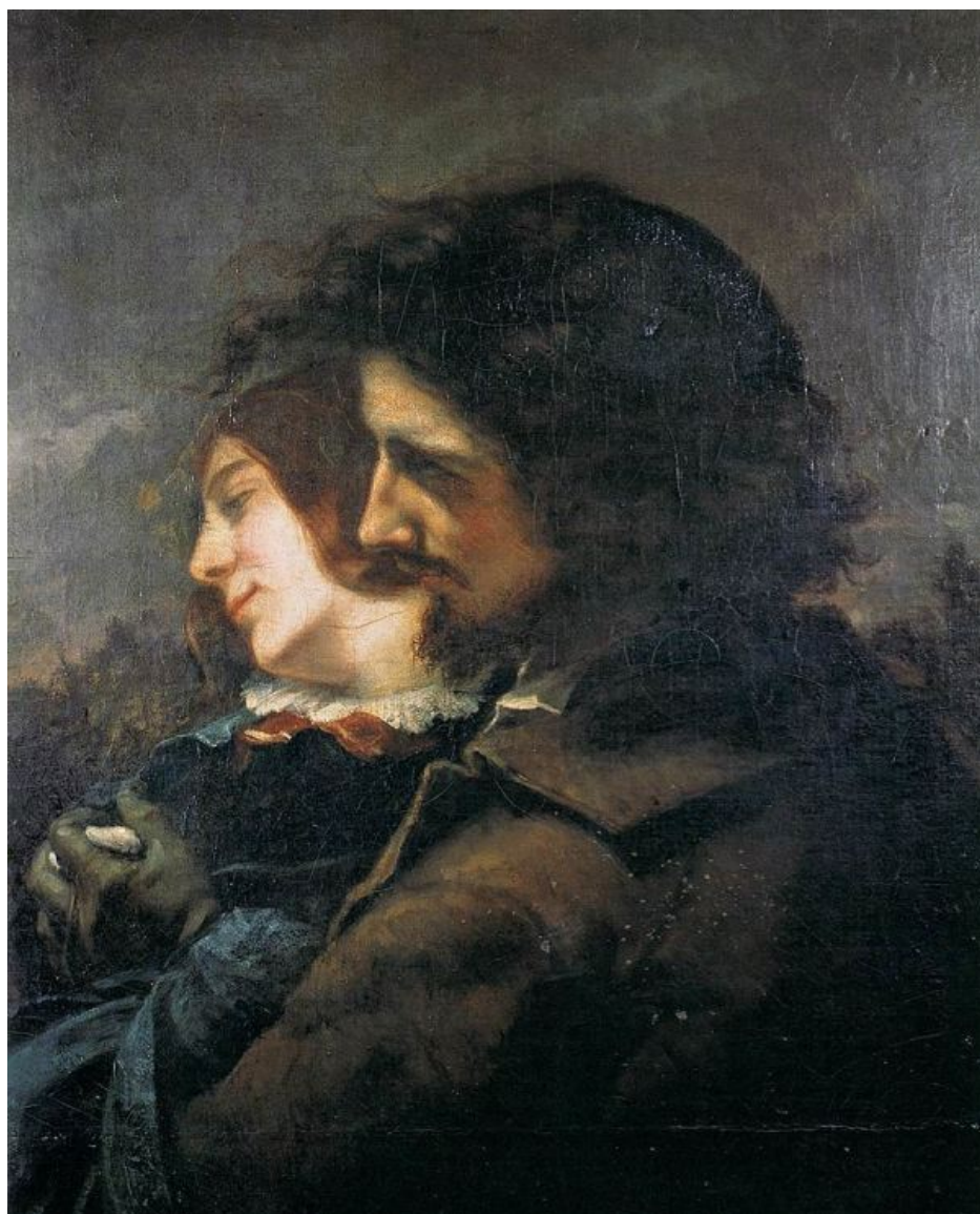
Jean Désiré Gustave Courbet (1819-1877), Les

Prime pubblicazioni: Corriere della Sera , 30 novembre 1913, poi in Un cavallo nella luna , Treves Milano 1918.