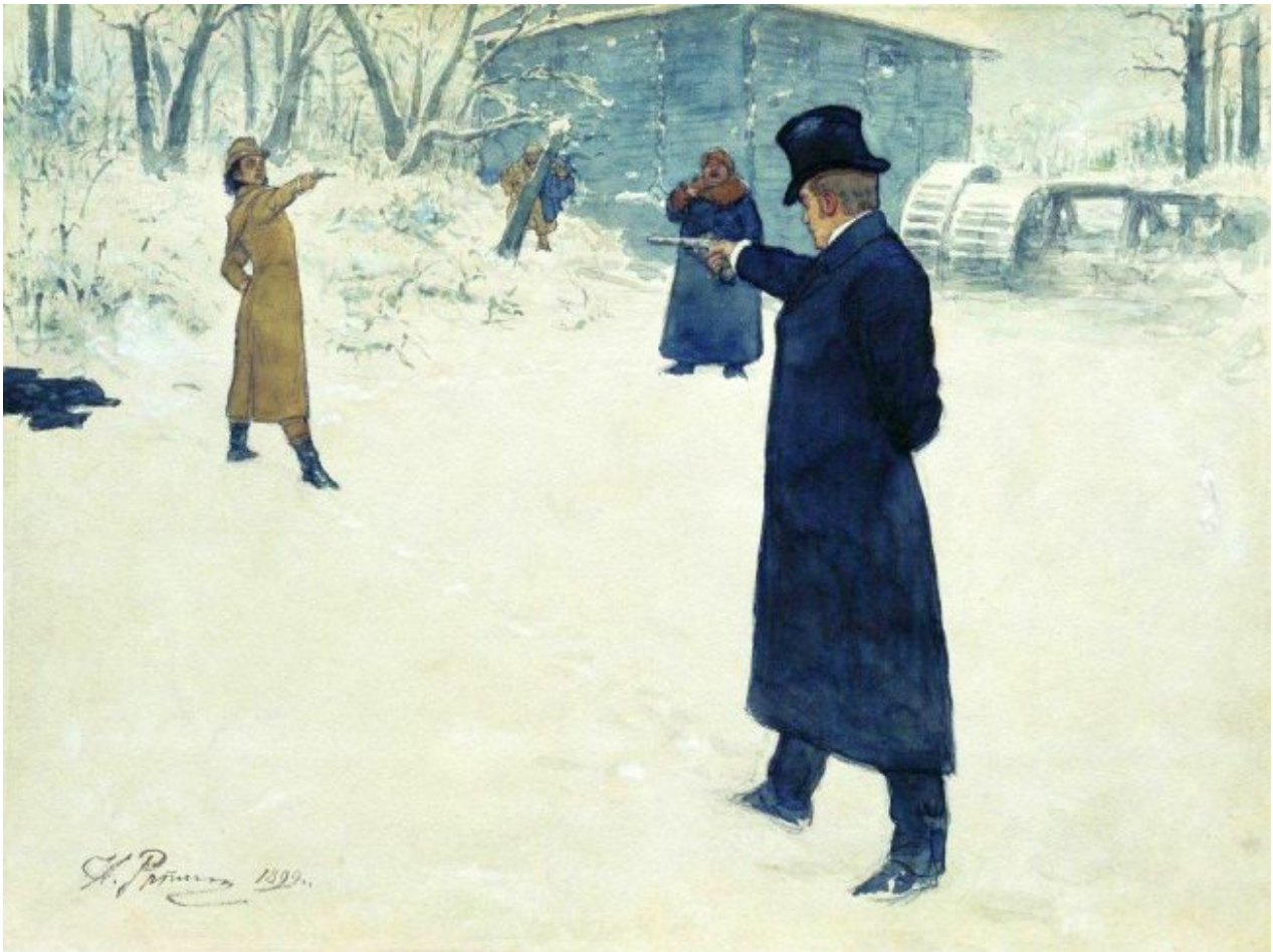
Ilya Repin (1884-1930), Duello tra Onegin e Lenski, 1899.

Prime pubblicazioni: Corriere della Sera , 10 aprile 1913, poi in Una giornata , Mondadori, Milano 1937.