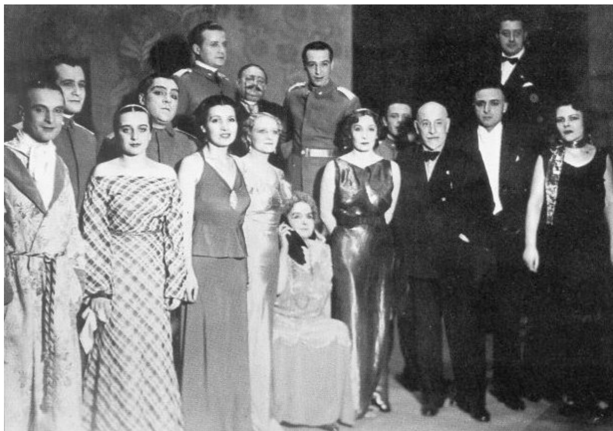
Pirandello con la Compagnia, Questa sera si recita a