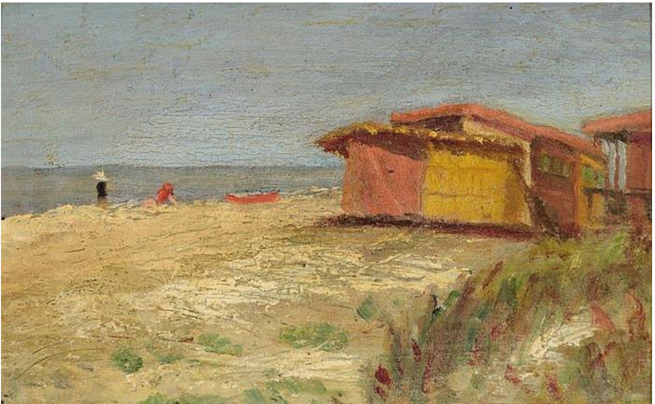
Luigi Pirandello, Marina vicino Viareggio.