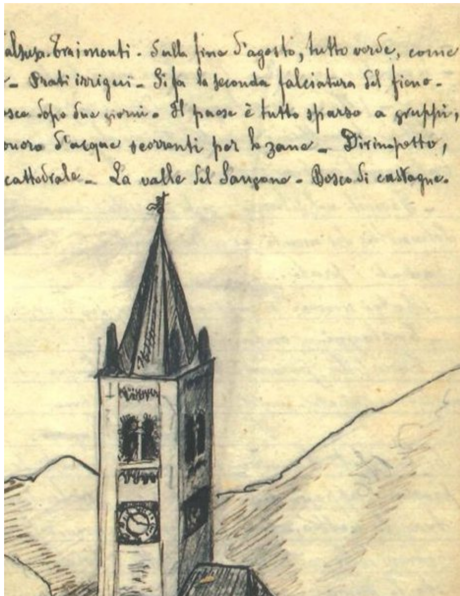
Il campanile della cattedrale di Coazze in uno schizzo del "Taccuino"

Nei taccuini e nell'epistolario pirandelliano è possibile ricostruire le tappe e i momenti essenziali di questa lunga fedeltà dello scrittore alla pittura. Non solo, ma occorre tener a mente che i taccuini sono ricchi di disegni e schizzi che testimoniano come la tecnica creativa pirandelliana passasse spesso dall'immagine alla parola scritta, da un dettaglio annotato o disegnato all'idea-base di un'opera narrativa. Ciò appare evidente se si pensa, ad esempio, al Taccuino di Coazze (appunti presi a Coazze nel 1901, a Montepulciano nel 1903 e altri sparsi) dove è possibile ammirare anche disegni e schizzi: il campanile della cattedrale di Coazze, un edificio medioevale, una candela