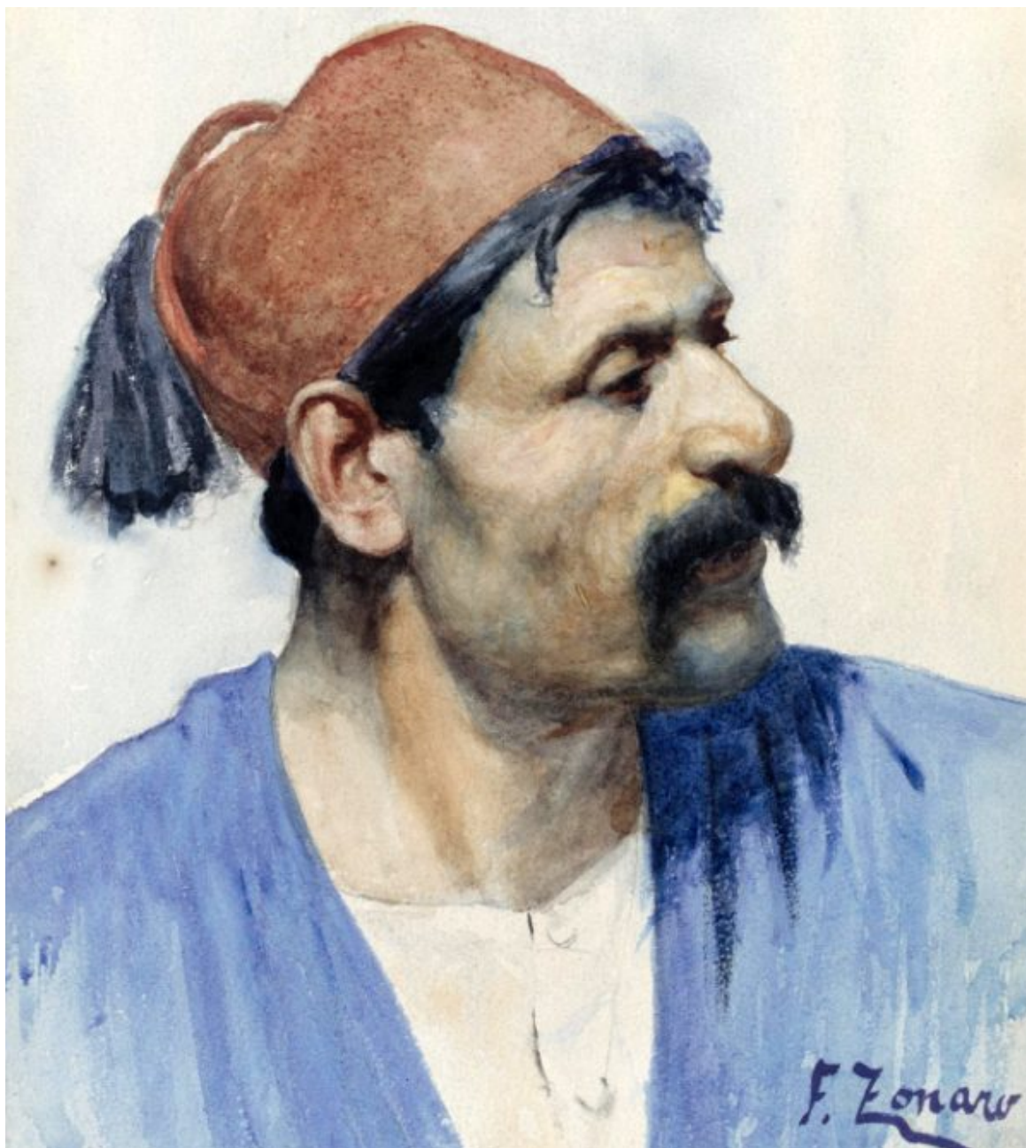
Fausto Zonaro (1854-1929), Testa di turco