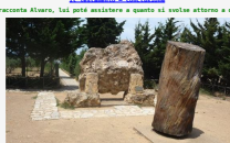
Il testamento - Appendice - I tre funerali