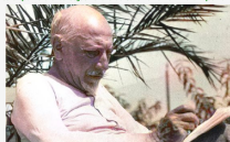
Il testamento - Capitolo 5. Carro d'infame classe, quello del morto

Di Pietro Sedió. Il fatto che non abbia voluto né fiori e cari ma è da considerare un capriccio quanto una conseguenza uomo nascita la nullità di quella vita che non voleva vestire, non poteva circondarsi di elementi così cari ai vivi: fiori e cari.