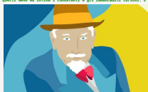
Il testamento - Capitolo 8. Il carro, il cavallo, il mulchino e la vita

Di Pietro Sedió. Prima di tutti i figli oculari anche loro, poi gli amici più "letiti", poi quelli meno ed infine i conoscenti e gli innamabili carissimi. E la notizia si sparse in un baleno tanto che i giornalisti che erano fuori la villetta torinese.