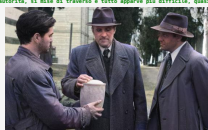
Il testamento - Conclusions