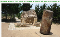
Il testamento - Appendice - I tre funerali