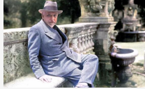
Il testamento - Capitolo 2. Non so come ad di essere

Di Pietro Sedió. In certi momenti di silenzio interiore, scriveva Pirandello, in cui l'anima nostra si scaglia di tutto lo fardello dell'altro, e gli occhi nostri diventano più acuti e penetranti, noi vediamo noi stessi nella vita e in sé stessa la vita quasi in.