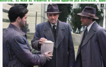
Il testamento - Conclusions