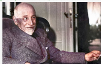
Il testamento - Capitolo 4. E anche fiori mi fanno a meno con amore

Di Pietro Sedià. Nella concezione di Luigi Pirandello esisteva una connessione tra l'uomo e il personaggio e in questo viene a mancare, la stessa esistenza dell'uomo si spoglia completamente per diventare modo ed allora a cosa servono i vestiti, gli orpelli. E quello che è.