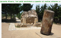
Il testamento - Appendice - I tre funerali