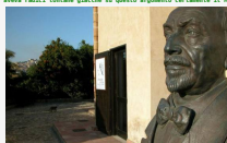
Il testamento - Capitolo 10. Il Calano

Di Pietro Sedià. Il problema che emerge da quella richiesta, per alcuni del tutto assurdo e anacronistico, aveva radici lontane giacché su questo argomento certamente il Maestro si era documentato e sapeva che quella pratica non era un capriccio, ma una "tradizione" che si perdeva.