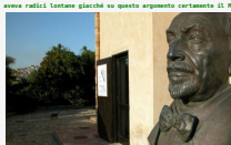
Il testamento - Capitolo 10. Il Calano