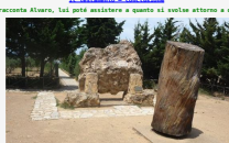
Il testamento - Epilogo - I tre funerali