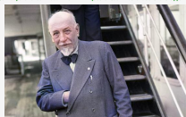
Il testamento - Capitolo 7. E nessuno s'accidenti ad parlarci di amici

Di Pietro Sedià. Nudo era nato in quella campagna agrigentina e nudo voleva ritornare. Nessuno avrebbe, a quel punto potuto contraddire. E in questa sua libera decisione appariva integralmente il concetto di vita che lo aveva alimentato secondo che la Chiesa, in particolare, avrebbe avuto.