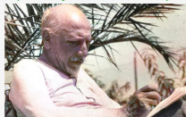
Il testamento - Capitolo 5. Carro d'infame classe, quello del morto

Di Pietro Sedià. Il fatto che non abbia voluto né fiori e cari ma è da considerare un capriccio quanto una conseguenza uomo nascita la nullità di quella vita che non voleva vestire, non poteva circondarsi di elementi così cari ai vivi: fiori e cari.