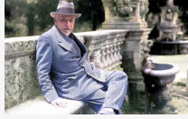
Il testamento - Capitolo 2. Non so come ad di essere

Di Pietro Sedià. In certi momenti di silenzio interiore, scriveva Pirandello, in cui l'anima nostra si scaglia di tutto lo fardello dell'altro, e gli occhi nostri diventano più acuti e penetranti, noi vediamo noi stessi nella vita e in sé stessa la vita quasi in.