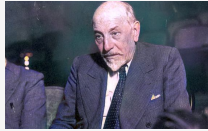
Il testamento - Capitolo 3. Mi s'incalza solo, io un italiano

Di Pietro Sedià. Occorre, di fronte a questa imperiosa richiesta, esaminare il concetto che animò l'Autore parlando dell'essere uomo e il suo pensiero che si è smolto attraverso tutti i suoi numerosi scritti. Un rapporto non sempre facile in quanto l'uomo era una parte importante.