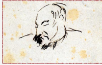
Il testamento - Capitolo 1. Sia lasciata passare in silenzio la mia morte

Di Pietro Sedià. Da testimonianze oculari si sapeva che il testamento era stato redatto qualche decennio prima che arrivasse la sua dipartita e che era stato vergato, dallo stesso, su un vecchio, sbiadito, foglietto. Era rimasto sepolto, tra le sue carte, per circa un venticinquesimo.