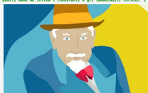
Il testamento - Capitolo 8. Il carro, il cavallo, il mulinello e la vita