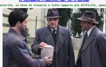
Il testamento - Conclusions

Di Pietro Sedià. Ne erano passati decenni sotto il cielo di Faro, La Chiesa, con tutta la sua autorità, al cielo di Trapani e tutto appariva più diretto, quasi impossibile. Ma davvero il Maestro non sarebbe più tornato nella sua terra natale? Il testamento di.