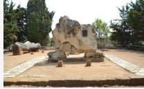
Il testamento di Luigi Pirandello