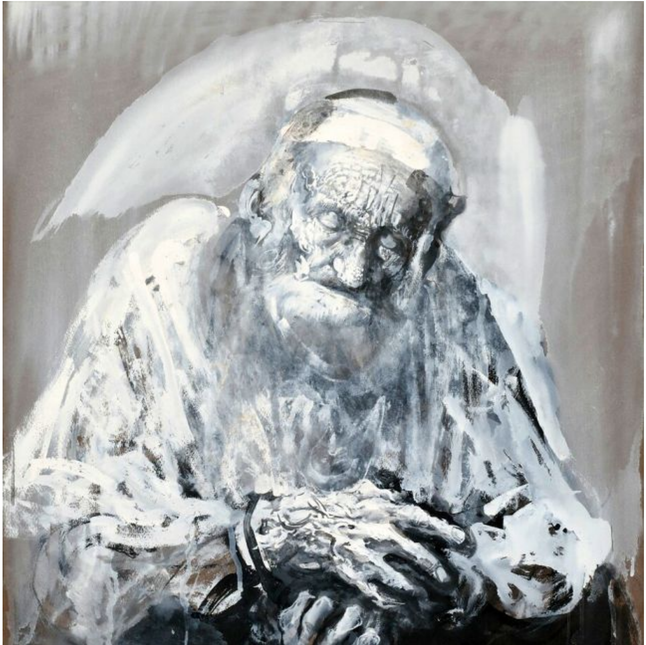
Hyman Bloom (1913-2009), Old Man Sleeping , 1956